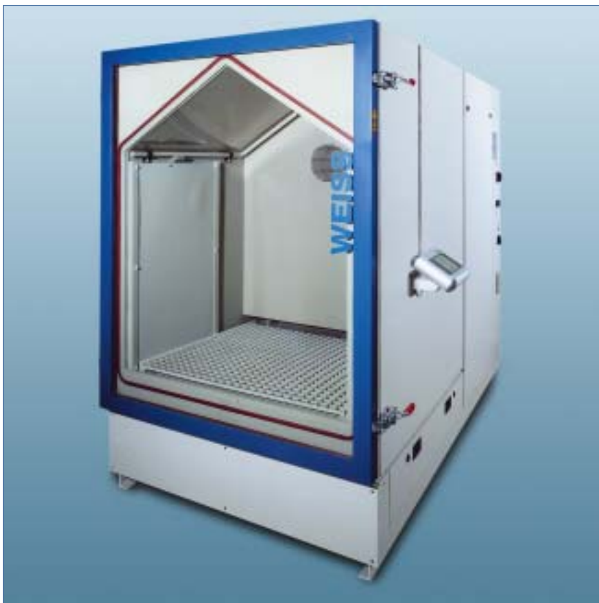
Klima-Wechsel-Korrosions-Kammer Typ SC 1000/+20 IM

Für Temperatur- und Klimaprüfungen steht eine komplette Produktlinie mit Prüfraumvolumen von ca. 34 l bis 2160 l und Arbeitsbereichen von -75 ... +180 °C und 10 ... 98 % r.F. zur Verfügung.